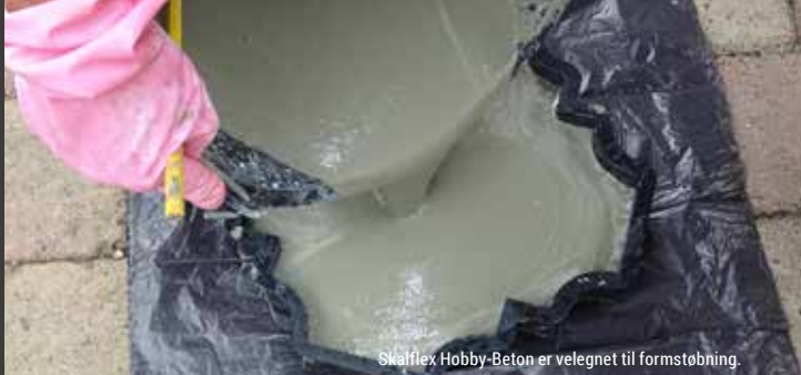
Skalflex Hobby-Beton er velegnet til formstøbning.